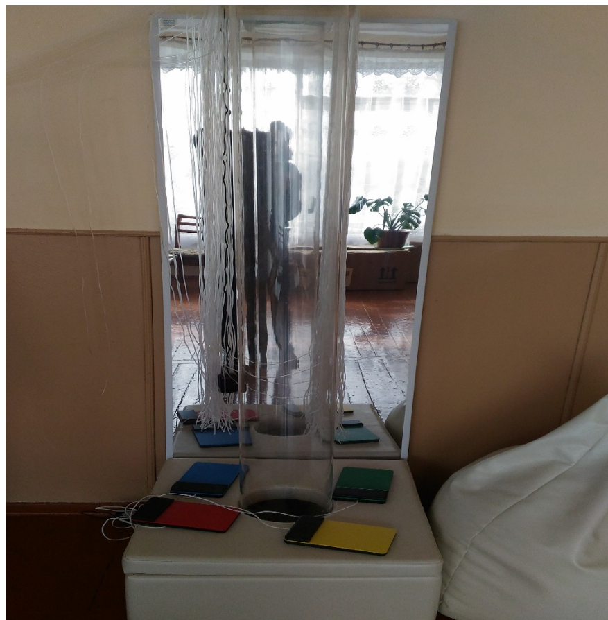
ИНТЕРАКТИВНАЯ ВОЗДУШНО- ПУЗЫРЬКОВАЯ ТРУБКА «МЕЧТА»