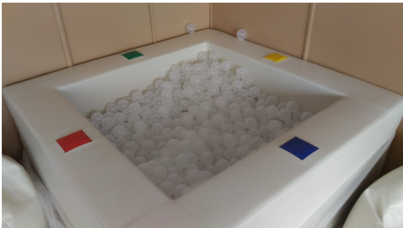
ВИБРОМУЗЫКАЛЬНЫЙ СУХОЙ БАССЕЙН