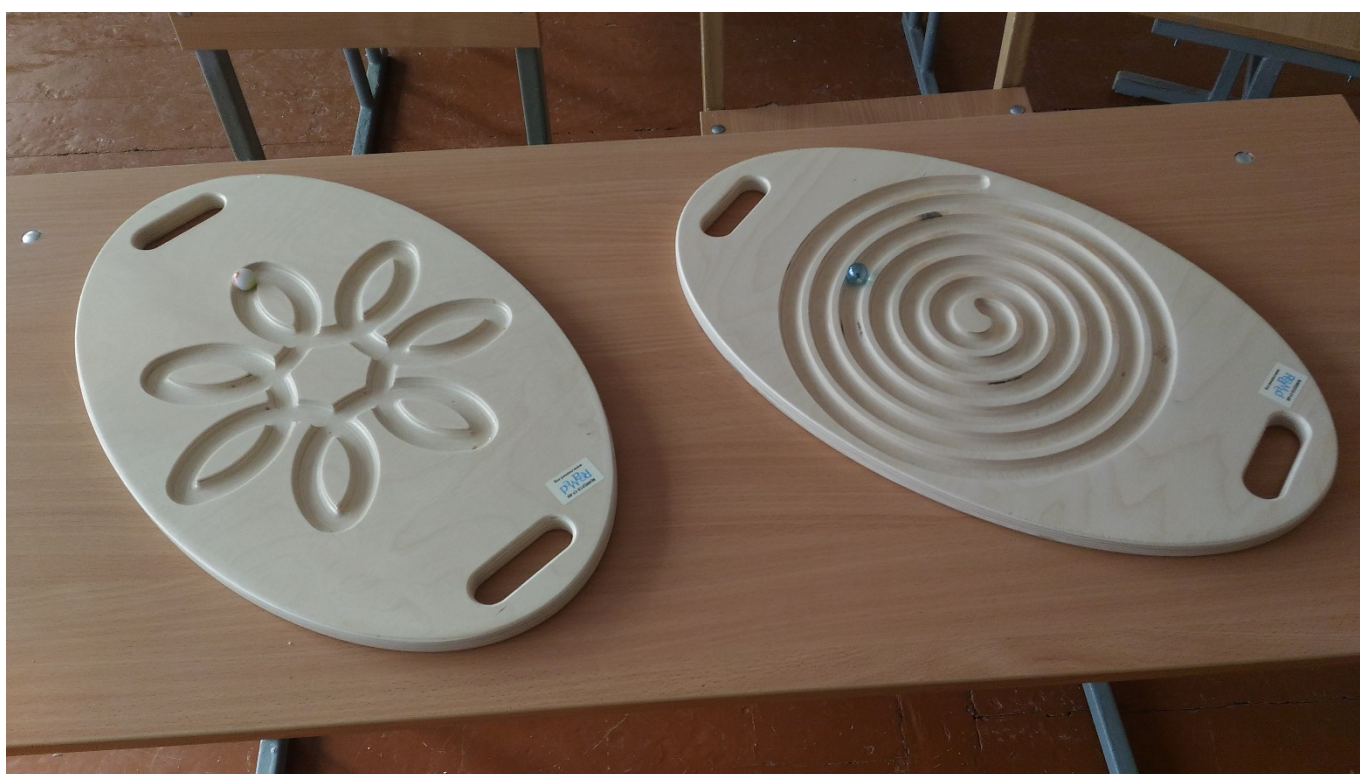
ЛАБИРИНТЫ «СПИРАЛЬ» И «ЦВЕТОК»