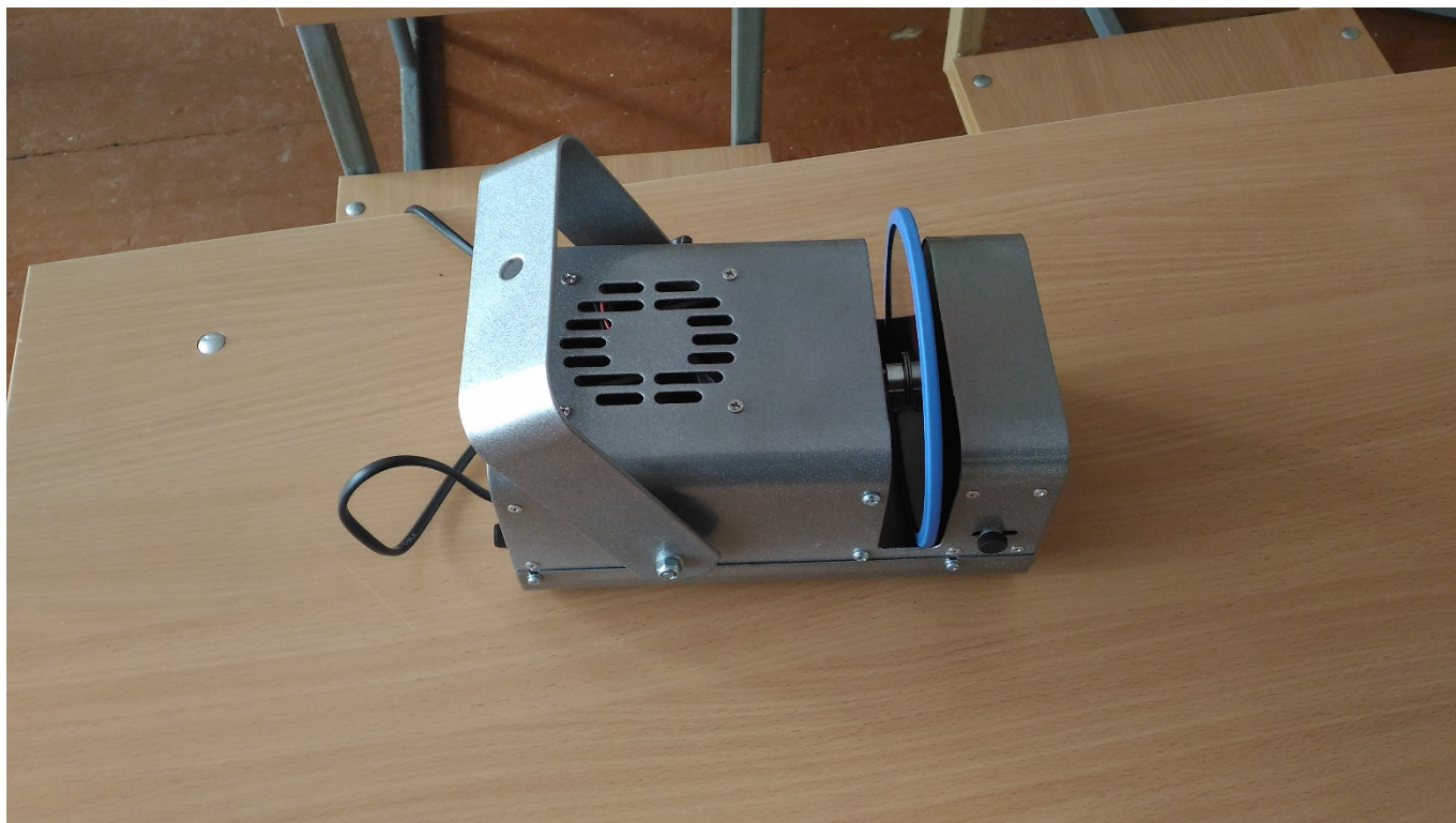
СВЕТОВОЙ ПРОЕКТОР «МЕРКУРИЙ»