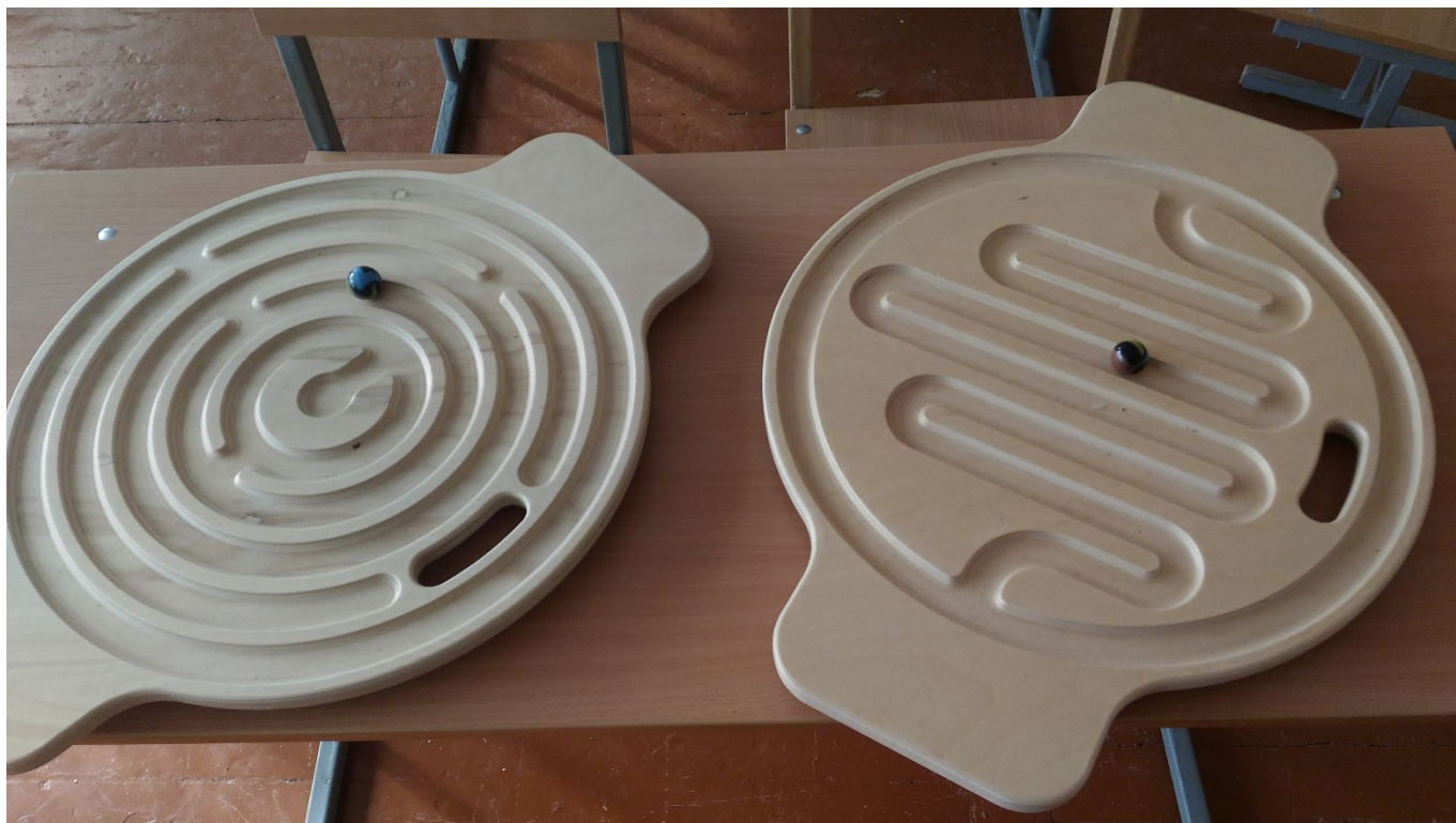
БАЛАНСИРОВОЧНЫЕ ДОСКИ - ЛАБИРИНТЫ