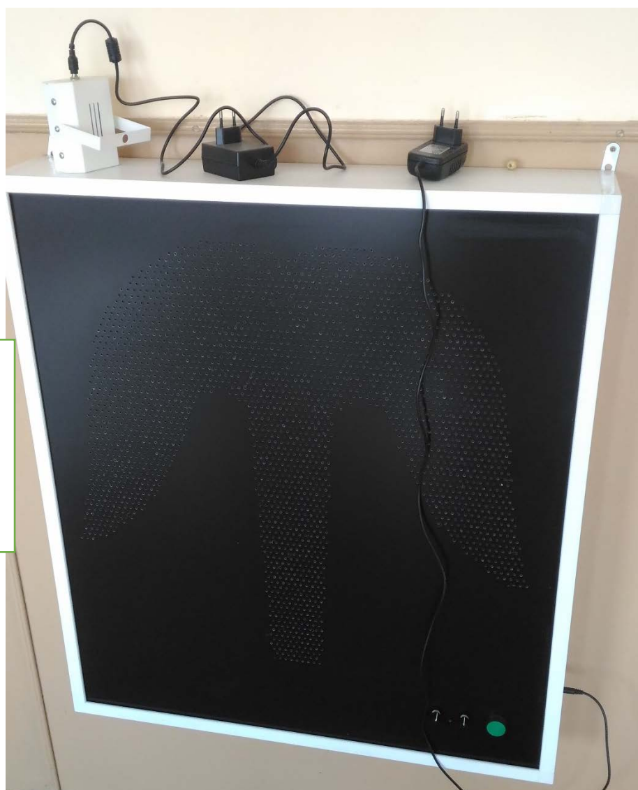
ИНТЕРАКТИВНАЯ СВЕТОЗВУКОВАЯ ПАНЕЛЬ «ФОНТАН»