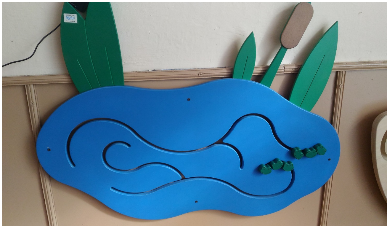
ДЕКОРАТИВНО – РАЗВИВАЮЩАЯ ПАНЕЛЬ «ПРУД»